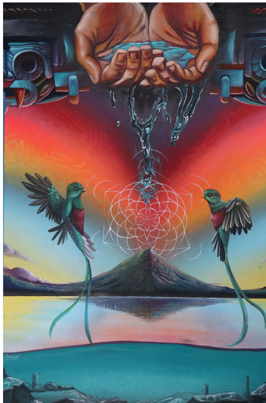
Técnica: Mixta José Manuel Chavajay San Pedro la Laguna