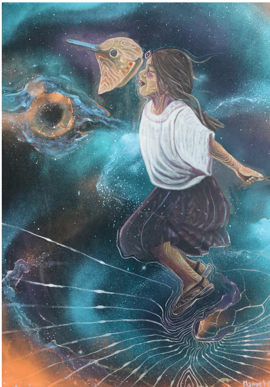
Técnica: Mixta Manuel Cruz Coché San Pedro la Laguna